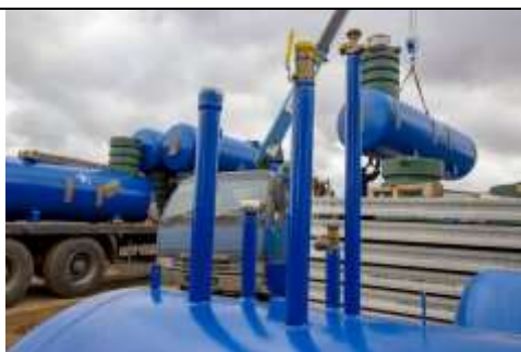
МЕДВЕДЬ (Россия), 3 патрубка