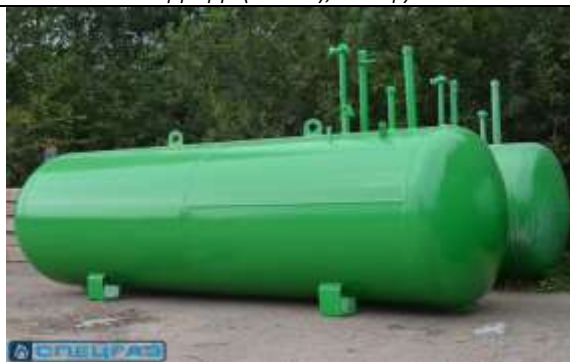
СпецГаз (Россия), 3 высоких патрубка